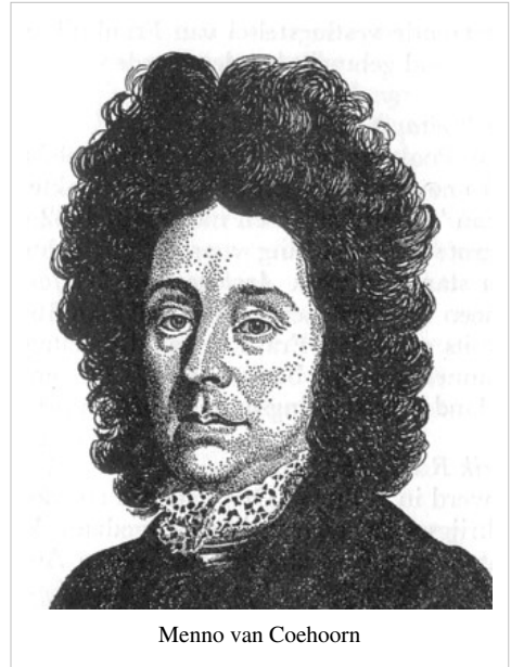
Menno van Coehoorn

Behalve nieuwe methoden in de vestingbouw heeft Van Coehoorn het Coehoorn Mortier uitgevonden (1674); een klein door twee mannen draagbaar mortier voor belegeringen. Het Coehoorn Mortier is nog tot ver in de 20e eeuw gebruikt door de marine als middel om bevoorradingskabels van een boot naar een andere boot te schieten en voor het werpen van lichtkogels.