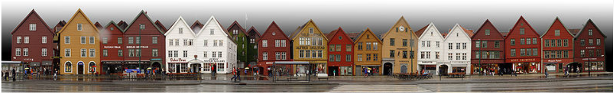
Panorama van de Tyskebrygge, de "Duitse kade", in Bergen.