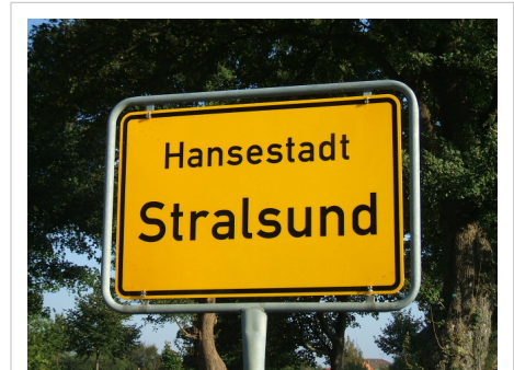
Stralsund, een Hanzestad

Dit is een regionaal gestructureerde lijst naar Dollinger van steden alwaar kooplieden tussen de 14e en 16 eeuw Hanzevoorrecht werd verleend (een deel slechts kort). Ongeveer 70 van de ongeveer 200 hier weergegeven steden bedreven een actief Hanzebeleid. De meerderheid van de Hanzesteden liet zich (zoals in de Hanzedagen) door een grotere naburige stad vertegenwoordigen.